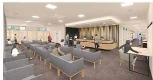
予防医療センターは南棟1階にオープン

健康管理センターは「予防医療センター」として、現在建設中の南棟に拡大移転します。オプション検査・専門ドックの充実など、当院の健診機能の強化にご期待ください。