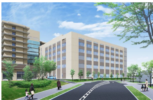
2021年完成予定の新棟