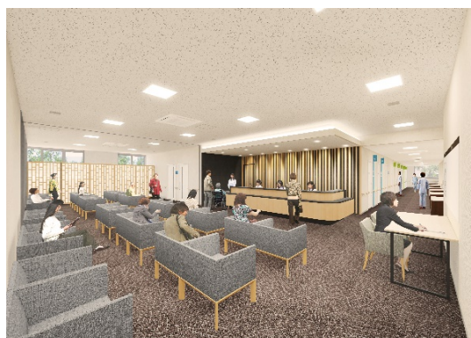
新棟に入る予防医療センター