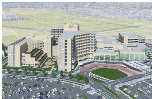
2022年に完了予定の発展的再構築

その第1弾として2021年6月に高精度放射線治療棟を開設します。また2021年12月頃には、がん医療をはじめとする高度急性期医療および、健診機能を充実させるため、6階建てとなる新棟を開設し2022年6月には既存棟の各機能を大幅に見直します。これらのプロジェクトを軸に高度医療・急性期医療を中心として機能をさらに高め、今後も安心して暮らせる地域づくりに貢献してまいります。