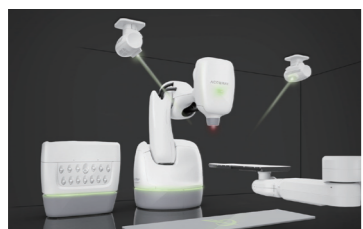
ロボットアームの先に放射線治療装置が取り付けられた「サイバーナイフ」