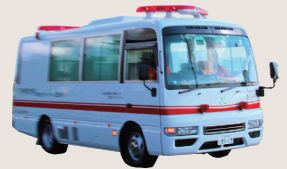
新生児センター開設と同時に、新生児ドクターカー「きらり」が稼働スタート！