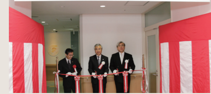
総合周産期母子医療センターの開設より一足早く、新生児センターを開設！