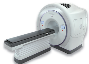
放射線の強度が変化する、強度変調放射線治療を使用した「トモセラピー」