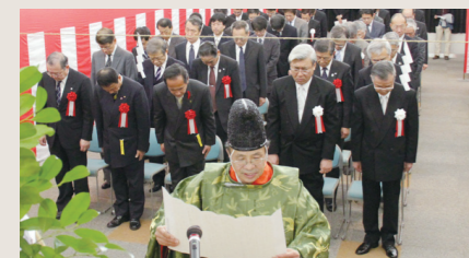
母体胎児センターの竣工をもって、当センターが開設！