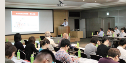
西三河のお産に関わる医療機関が集まり、意見交換を行っています！