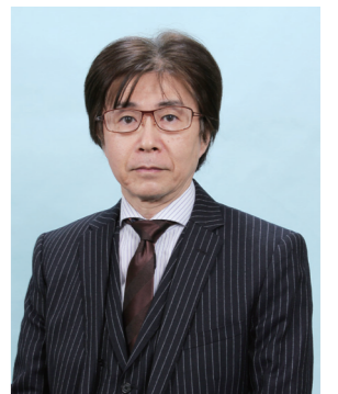
病院長 度会 正人 Masahito Watarai